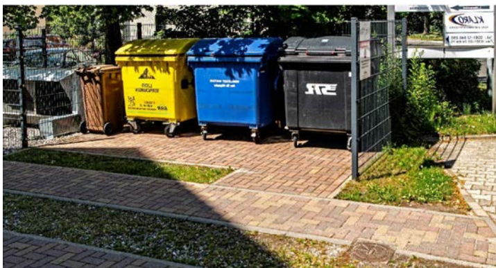
Aufstellung ohne Witterungsschutz