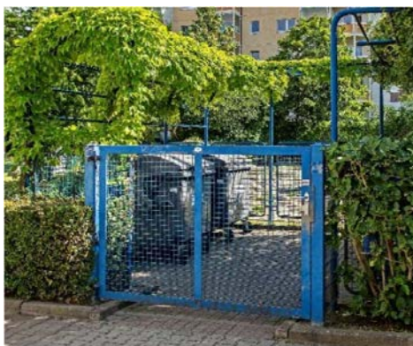
Zaunanlage mit Tor