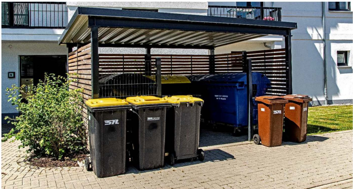
Mülltonnen mit gelben Deckel und Mülltonnen komplett in braun bzw. blau